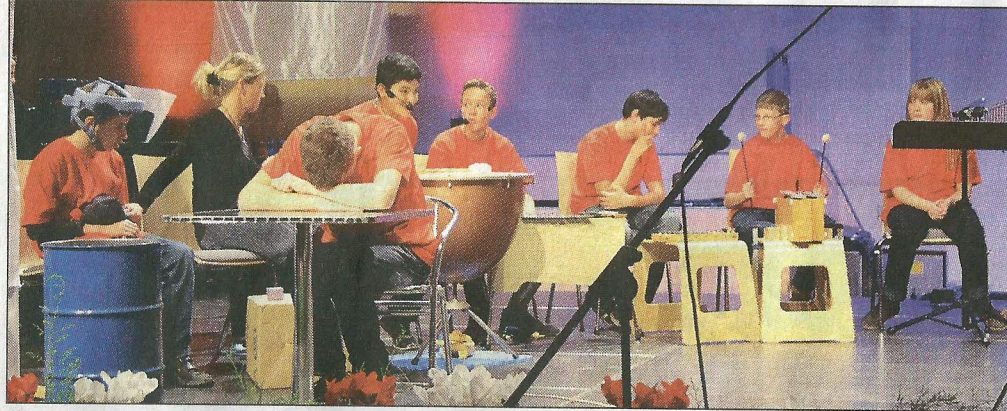
Einen musikalischen Traum für Sprecher, Schauspieler und Instrumente führten Schülerinnen und Schüler der Peter-Räuber-Schule und das Blockflötenensemble der Musikschule auf.