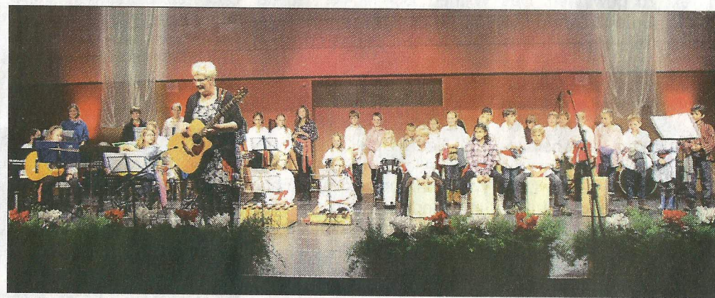
Die Grundschule Halchter und die Kultur Schmiede Denkte nahmen die Besucher der Lindenhalle mit auf eine „Russlandreise“.